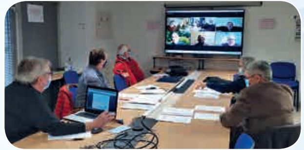
L'AG s'est tenue en visioconférence.