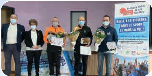
Remise des diplômes à 10 bénévoles du secteur de Champagny par petits groupes.