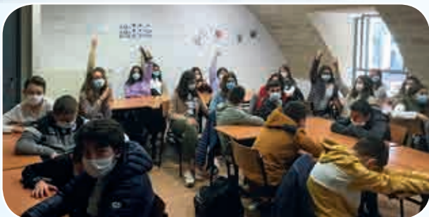
Beaucoup de participation lors de ces journées.