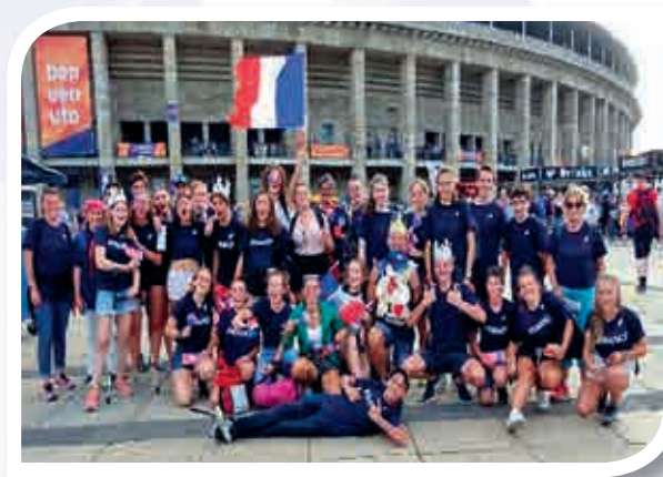
Jeunes Juges d'athlétisme en compétition internationale.